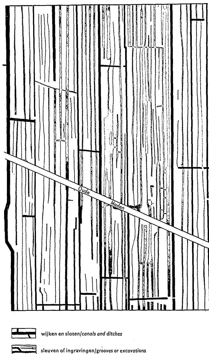
Fig. 2. Detail van het systeem van sleuven of ingravingen Fig. 2. A detail of the system of grooves or excavations

De sleuven zijn uitgegraven tot een diepte van 80 à 130 cm, gerekend vanaf het maaiveld van de hagen. De mogelijkheid om tot deze diepte zonder speciale voorzieningen voor de waterafvoer het veen uit te graven is gedurende de zomermaanden zeker aanwezig. De doorlatendheid van het veen is beneden de grondwaterspiegel vrij gering – gemiddeld 15 cm per etmaal –, zodat in de zomermaanden tot diep onder het slootpeil gegraven kan worden.