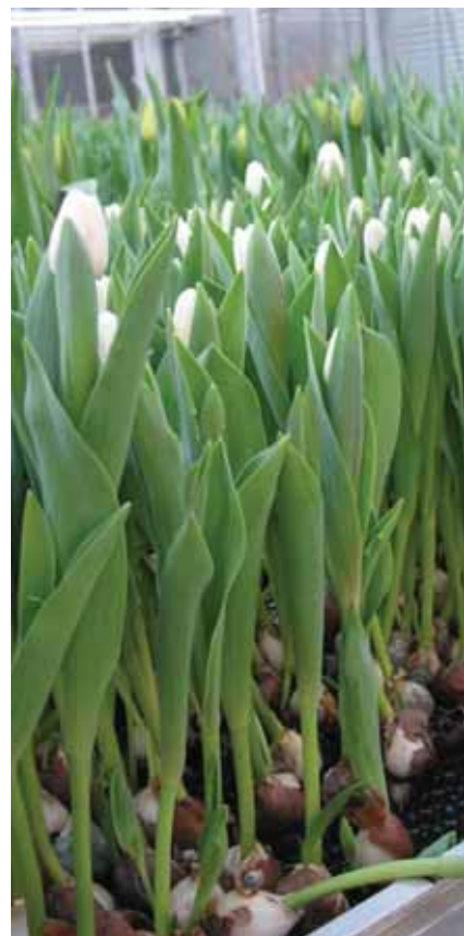
'White Dream' gebroeid op een eb- en vloed-systeem in week 9