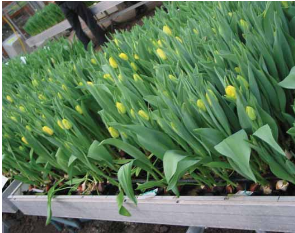
'Monte Carlo' continu druppelen in week 9

In tabel 1 wordt het effect van langer bewortelen op de kwaliteit van de planten weergegeven. Hieruit blijkt dat bij twee weken bewortelen de trek-