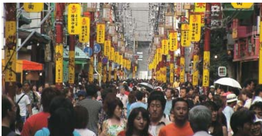
De vraag naar elektriciteit groeit net zo snel als de bevolking in China.

De vraag naar elektriciteit in China groeit explosief. Het opwekken van elektriciteit gaat