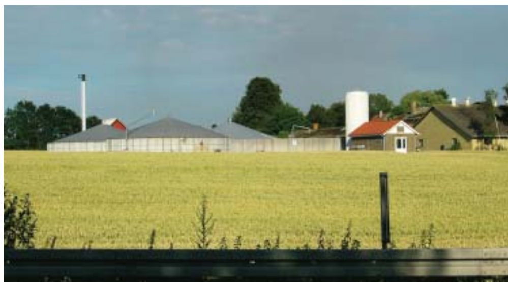
Deense varkenshouderij op Seeland. Overdekking van mestsilos in verband met biogasproductie.

Het Deense bedrijf TiCan ontwikkelde een ingenieuze internationale strategie. Het bedrijf produceert en slacht varkens in Denemarken, maar verwerkt deze in Polen en het Verenigd Koninkrijk. TiCan neemt de slacht van 7,5% (1,7 miljoen) van de Deense varkens voor zijn rekening. Een Poolse vleesverwerker verdient maar DKK 22 per uur (€ 2,93), terwijl het Deense uurtarief DKK 225 per uur (€ 29,93) bedraagt. Voorlopig realiseert TiCan samen met zijn Poolse partner Prime Food op de Deense markt een afzet van DKK 400 miljoen op Deense grondstoffen gebaseerde en uit Polen afkomstige worst- en charcuteriep-