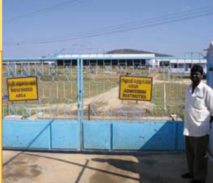
Het Indiase pluimveebedrijf Pioneer, partner van Hybro.

Een recente ontwikkeling is een verbod op het slachten van (pluim)vee in de grote steden, zoals Bombay, Calcutta en New Delhi. Dit omdat het thuis slachten grote hoeveelheden slachtafval en daarmee vervuiling in deze steden met zich mee brengt. Door deze groeiende aandacht voor hygiëne ontstaan er mogelijkheden voor de ontwikkeling van slachterijen en verwerkers buiten de steden.