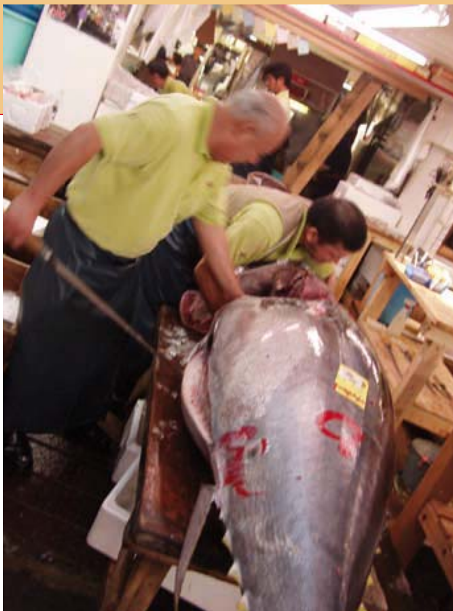
Deze en vorige pagina: de verwerking van tonijn op de Tsukiji-vismarkt in Tokyo.

De Japanse maakt zich geen zorgen over het dalende aanbod, omdat ze erop vertrouwen dat er uiteindelijk wel een technische oplossing wordt gevonden. De milieuvervuiling die in de jaren '60 zoveel slachtoffers