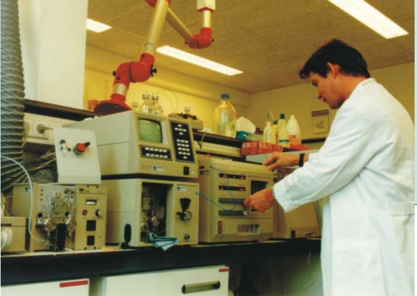
HPLC (High Performance Liquid Chromatography; vloeistofchromatograaf).

voedingsmiddelen. Met andere woorden: het genereert en kanaliseert wetenschappelijke kennis om een bijdrage te leveren aan de innovatiekracht van de Nederlandse voedingsmiddelenindustrie. WCFS kent drie onderzoekprogramma's: Voeding en Gezondheid, Structuur en Functionaliteit, en Microbiële Functionaliteit en Veiligheid. Er werken op dit moment zo'n 180 onderzoekers voor WCFS op de deelnemende onderzoeksinstituten. De onderzoekresultaten worden gepubliceerd in internationale wetenschappelijke tijdschriften. Deelnemers aan WCFS nemen als eersten kennis van de onderzoekresultaten en kunnen zo hun voordeel doen met hun plek 'op de eerste rij'. Zij hebben ook rechten op de intellectuele eigendom d.m.v. octrooien. WCFS maakt deel uit van nationale en internationale netwerken, zoals het Kluyver Centre for Genomics of Industrial Fermentation en het Innovative Cluster Nutri-genomics en participeert in verschillende projecten van de Europese Unie. Het instituut geniet een goede reputatie in het buitenland, hetgeen onder andere blijkt uit een vermelding van de OESO over WCFS als exemplarisch voor publiekprivate samenwerking.