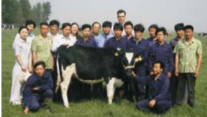
Laurentien, het eerstgeboren kalf op Siddair

gebruiken Nederlandse bedrijven het project om hun producten grotere bekendheid te geven in de Chinese markt en is Nederland nauw bij het project betrokken. Henan, de belangrijkste veehouderijprovincie van China, is vooral gericht op varkens, vleesvee en pluimvee. Het is van oudsher niet de provincie waar de grootste activiteit van melkveehouderij plaatsvond, maar deze sector ontwikkelt zich nu snel. In de provincie, die vijf keer het oppervlak van Nederland beslaat, wonen 100 miljoen mensen. Henan is momenteel de snelst groeiende provincie in Midden-China en heeft ambitieuze plannen om langs de Gele Rivier de zogenoemde Green Belt production and demonstration base op te zetten. Midden in deze groene belt, waar men 300.000 koeien wil gaan melken, langs de Gele Rivier (250.000 ha) ligt het Siddair-project. Nog steeds trekt het project elk jaar meer bezoekers.