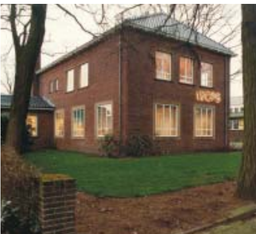
Zetel hoofddirectie van het WCFS.

Meer informatie en wetenschappelijke publicaties zijn te vinden op de website van WCFS: www.wcfs.nl .