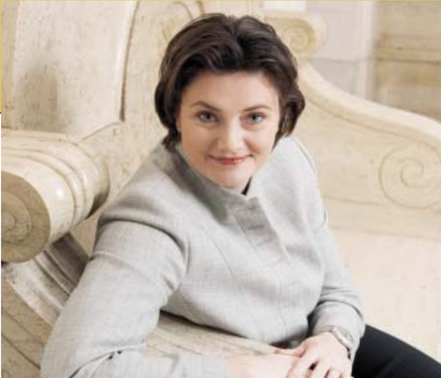
Staatssecretaris Karien van Gennip.