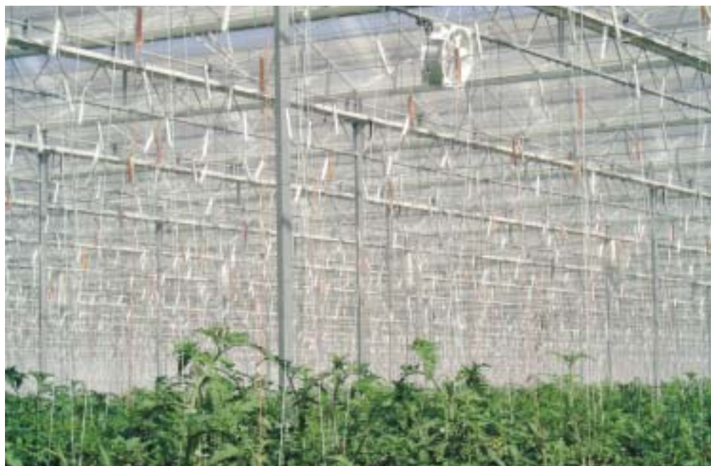
Hoge (5,5 m) moderne glazen kassen (Venlo-type) in Mexico met verwachte opbrengst van ca. 70 kg. tomaat per m 2 .

Vooral als gevolg van een groeiende export naar de VS is er sinds zes jaar sprake van een sterke ontwikkeling van de beschermde teelt. De kassenteelt heeft zich voornamelijk in het noordwestelijk deel van Mexico ontwikkeld. Daar bevindt zich meer dan 60% van het totale Mexicaanse kassenareaal van zo'n 2400 ha. Concentratiegebieden zijn de staat (schiereiland) Baja California (bijna 600 ha), de noordwestelijk gelegen kuststaten Sinaloa en Sonora (ruim 800 ha), de westelijke kuststaat Jalisco (450 ha) en de hoger gelegen staten in het binnenland (ruim 100 ha). Tussen deze gebieden bestaat een aantal belangrijke verschillen. Zo is in de noordwestelijk gelegen staten sprake van een wat lager technologisch niveau. De kassen met betere, vaak