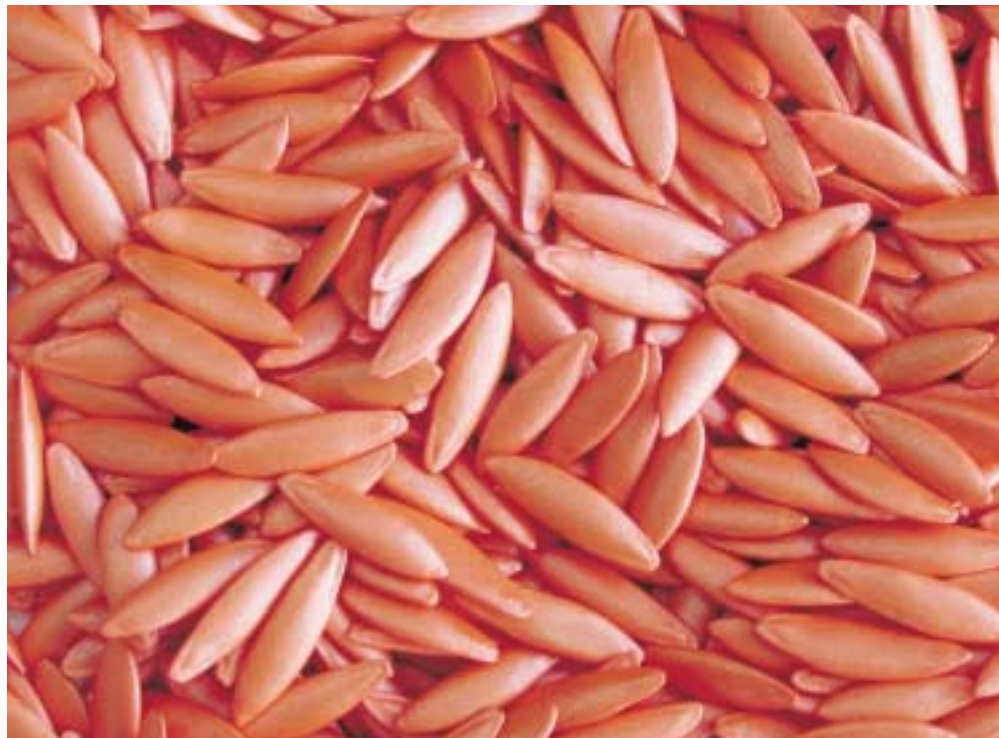
Komkommerzaad met een coating.

Omdat East West zelf geen ervaring heeft met insecticidocoatings, zocht het bedrijf contact met het instituut Praktijkonderzoek Plant en Omgeving (PPO) van Wageningen Universiteit en Researchcentrum (WUR). Dit instituut is nauw betrokken bij het onderzoek naar insecticidocoatings voor Nederlandse groenten. Flip van Koesveld, landbouwkundige en projectmanager Azië bij PPO, geeft uitleg: "Doordat het bestrijdingsmiddel om het zaadje heen zit, wordt het opgenomen door de hele plant. De dosering