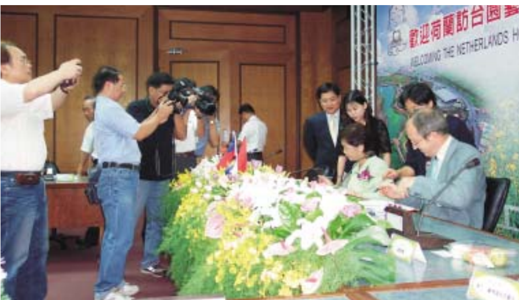
Ondertekening samenwerkingsprotocol tussen gemeente Westland en Taiwan.