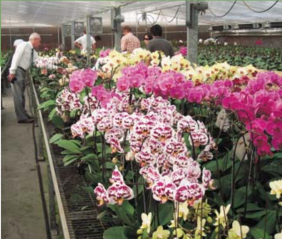
Kas met orchideeën.

zelf beslaat ongeveer 12.500 ha, waarvan 54% is bestemd voor de boomkwekerij (grotendeels graszoden), 36% voor de teelt van snijbloemen, 6% voor bloeiende potplanten en 4% voor de teelt van orchideeën, zoals Phalaenopsis en Oncidium.