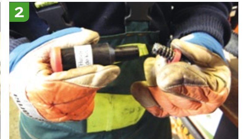
2 Pompgedeelte loshalen Let op dat u het veertje van het pompje ook uit de vetspuit haalt en het veertje niet kwijtraakt.