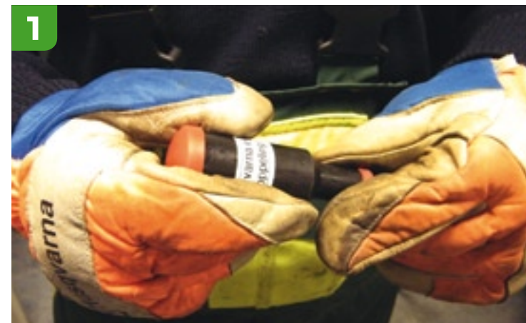
1 Demonteren vetspuitje Pak het vetspuitje stevig beet en trek aan de kleine rode ring, zodat het pompje loskomt.

uit de groene praktijk is juist om via de smalle voorkant, het pompje, het vetspuitje te vullen. Dit kan met de vettube die bij de motorzaag wordt geleverd, maar het kan ook met de grote vetspuit die voor trekkers en andere machines wordt gebruikt. Voor het naaldlager kunt u gewoon lagervet gebruiken. Het speciale vet voor de haakse overbrenging van de bosmaaier is niet bedoeld voor het naaldlager van een motorzaag. ■