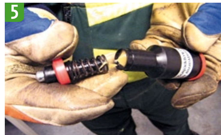
5 Monteren vetspuitje Monteer de grote rode dop achterop de pomp. Duw het pompje weer in de vetspuit en druk de kleine rode ring aan tot die vastklikt.