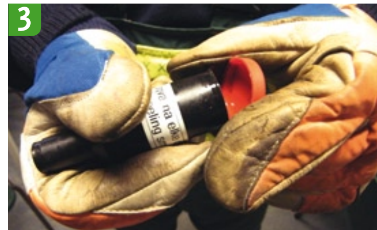
3 Rode dop loshalen Haal de grote rode dop van het vetreservoir. Nu kunt u de rode zuiger in het vetspuitje zien. Deze zuiger zorgt ervoor dat er geen lucht wordt aangezogen tijdens het smeren van het naaldlager.