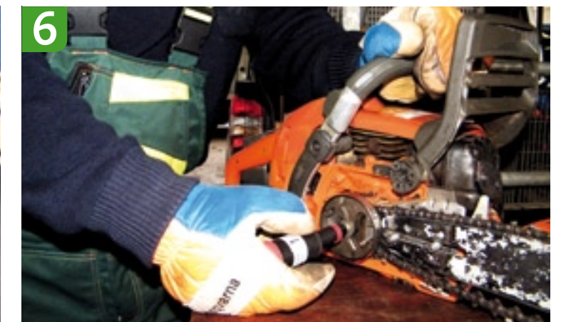
6 Ontluchten vetspuitje De eerste paar keer pompen kan erg licht gaan. Dan zit er nog wat lucht in de vetpomp die er eerst uitgepompt moet worden. Als u weerstand voelt, wordt er weer vet gepompt.