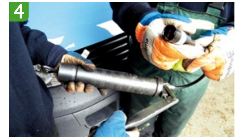
4 Vullen met vetspuit (of vettube) Houd de vetspuit stevig tegen de smalle opening (waar het pompje zat) van het vetspuitje. Pomp er zoveel vet in totdat de zuiger weer bijna bovenaan het vetreservoir staat (zie grote foto op de linkerpagina).