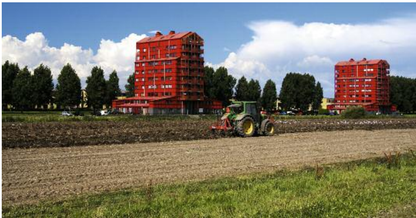
Impressie van landbouw in de stad.

De kiem voor het project Agromere is gelegd in 2002. Wageningen UR voerde in opdracht van LNV een toekomstverkenning uit naar duurzame landbouw in 2020. Stakeholders uit diverse maatschappelijke geledingen werkten individueel en in workshops beelden uit van die toekomstige landbouw. Voor de plantaardige sectoren leverde dit onder meer het beeld op van landbouw direct in en om de stad (Klein Swormink en Krikke, 2004). Het systeeminnovatie-