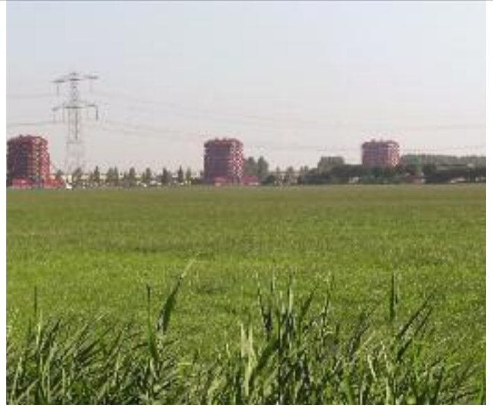
Almere moet tot 2030 60.000 woningen erbij bouwen. Aan de oostkant zijn mogelijkheden voor woningbouw gecombineerd met landbouw.